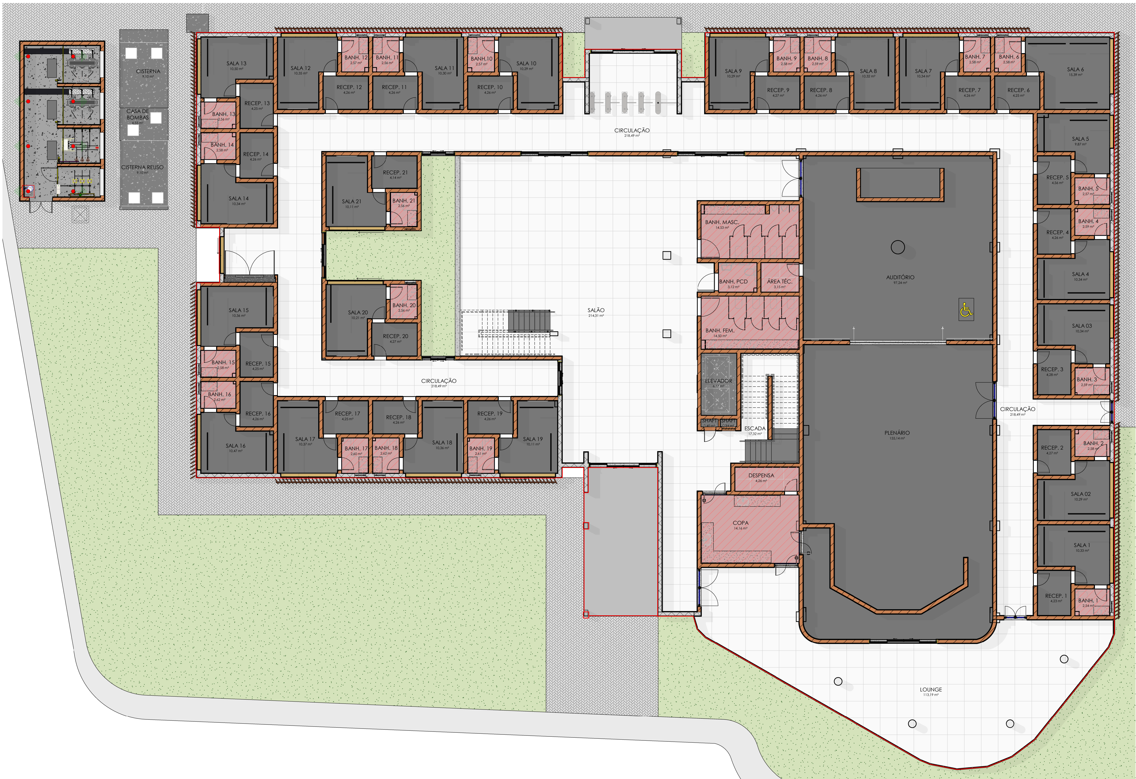
1 PLANTA DE IMPERMEABILIZAÇÃO - TÉRREO Escala 1 : 100